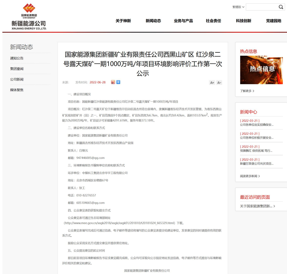
图 1 第一次网络公示环评信息情况