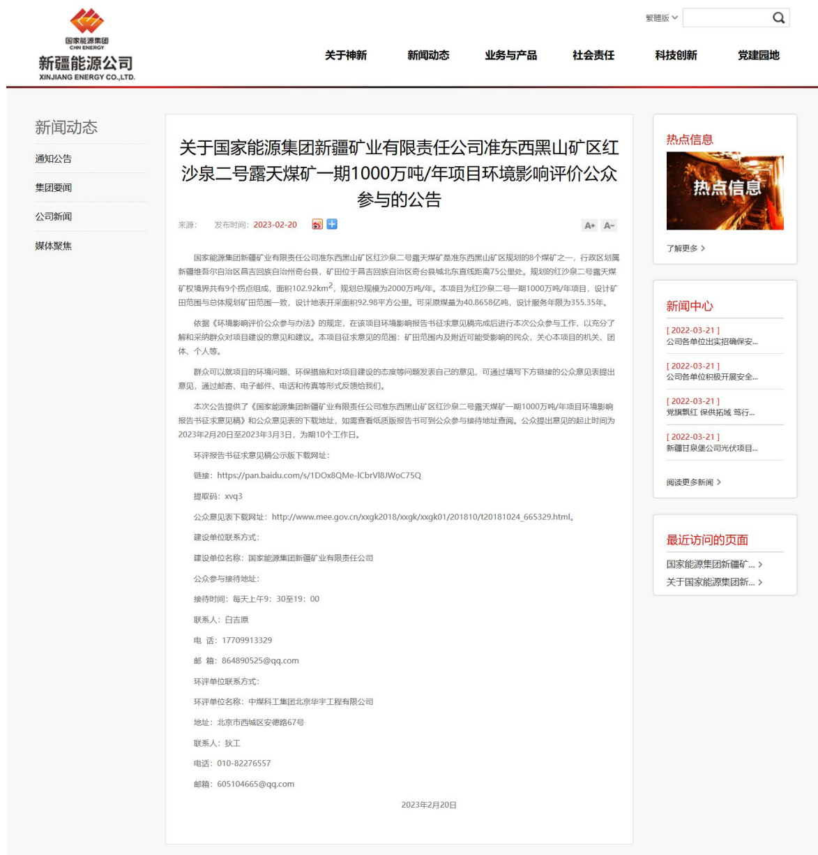
图 2 项目网站公告情况