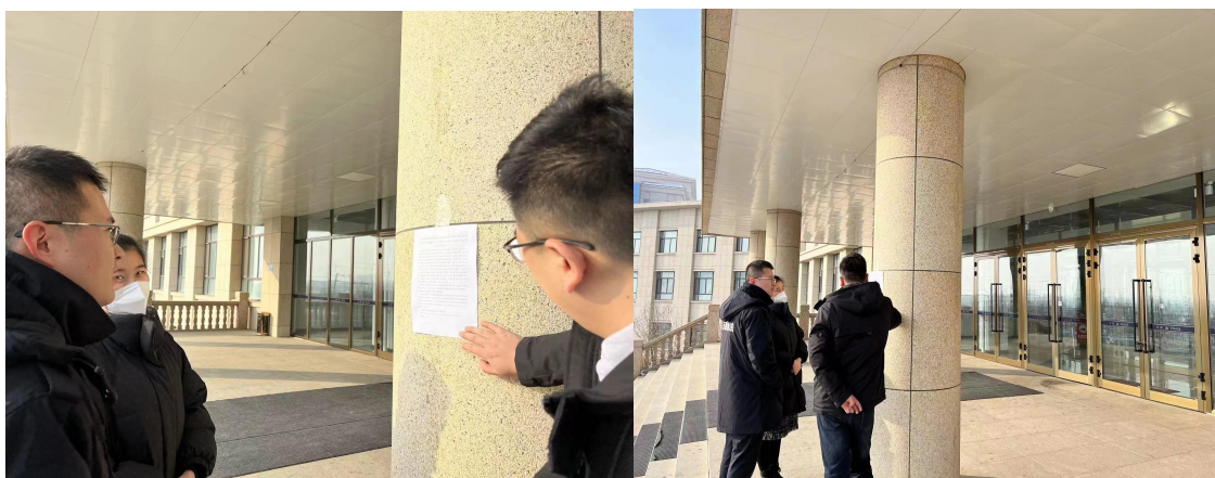
图 5 张贴公告情况